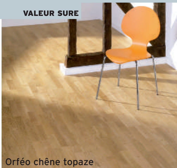
Orféo chêne topaze